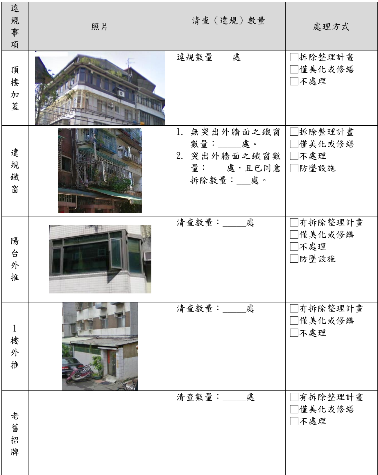
表 3-1 違建及違規物分析表