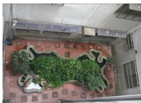
中庭水池易生病媒蚊