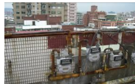
屋頂瓦斯表及管線