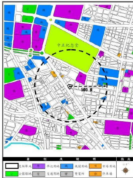
周邊公共設施及觀光景點分布圖

八、基地範圍半徑五百公尺內土地使用現況/交通系統現況/公共設施現況/觀光景點等地區發展狀況說明（請以文字說明並於圖面標明）：