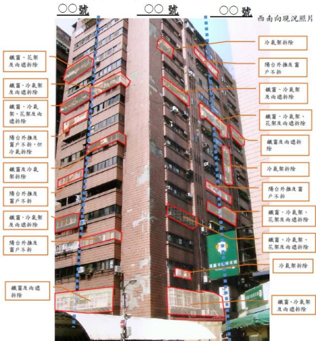
圖 3-1 違建及違規物拆除意願結果分析圖