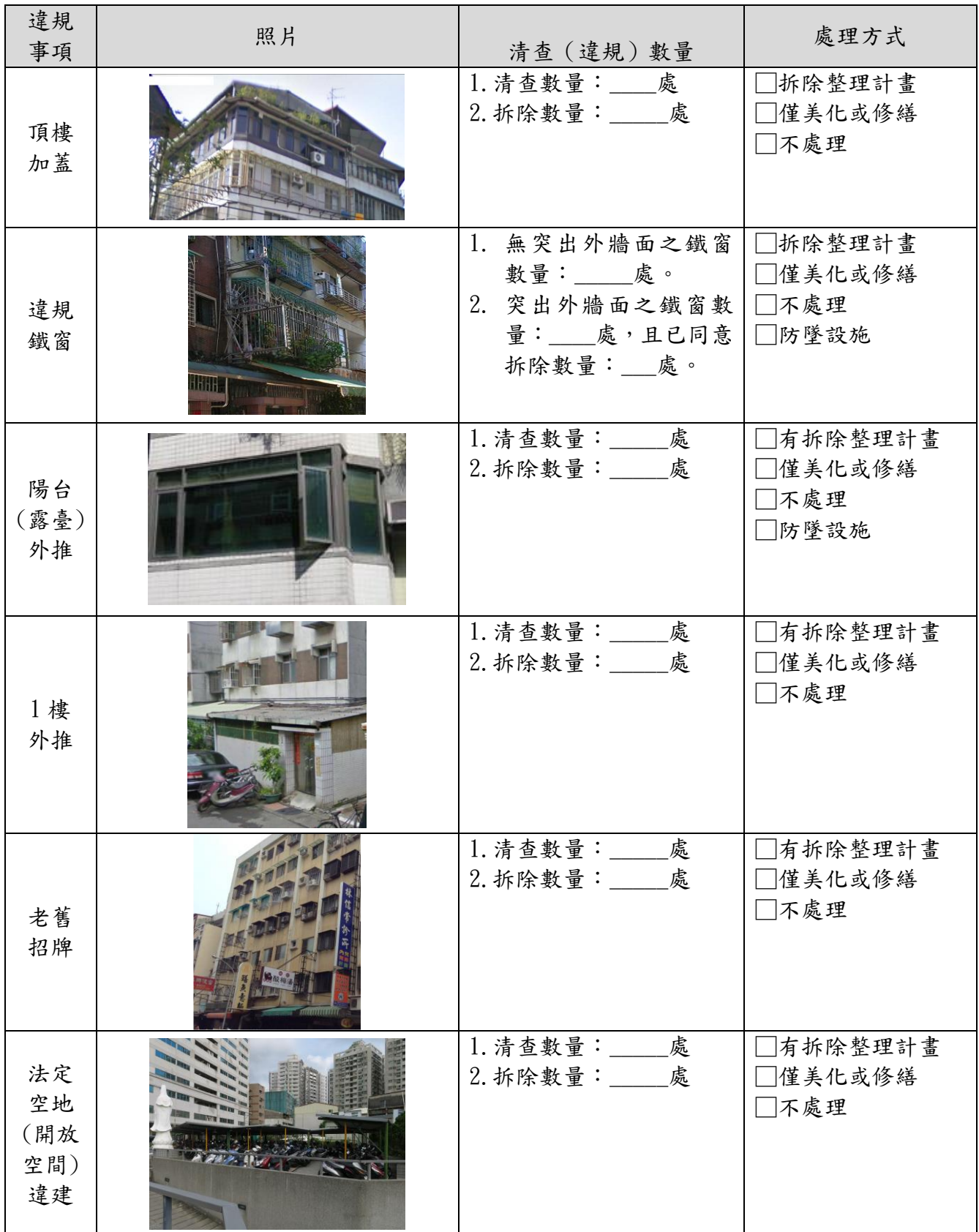
表 3-1 違建及違規物分析表